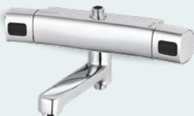
FM Mattsson Siljan Badkarsblandare