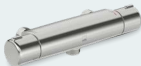
Oras Nova Duschblandare