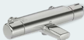
Oras Nova Badkarsblandare