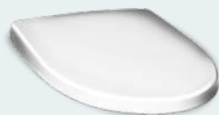
IFÖ Spira hårdhits