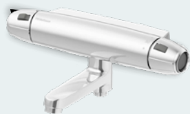
FM Mattsson 9000 E II Badkarsblandare