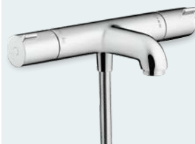
Hansgrohe Ecostat 1001CL Dusch- & karblandare