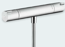
Hansgrohe Ecostat 1001 Duschblandare