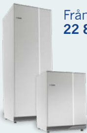
Nibe Compact 300I CU Steatite