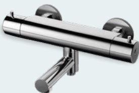
Tapwell EVO Dusch- & karblandare