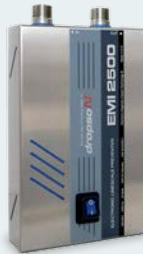
Dropson EMI 2500 Kalkavvisare